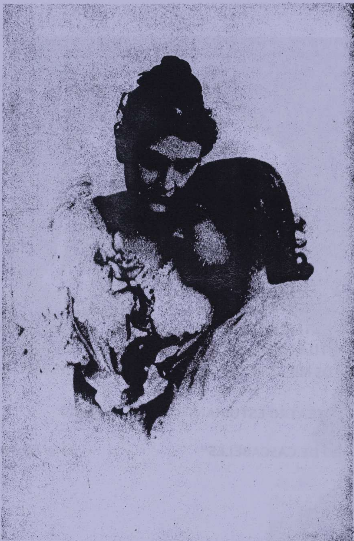
Helen Keller y Anne Sullivan.